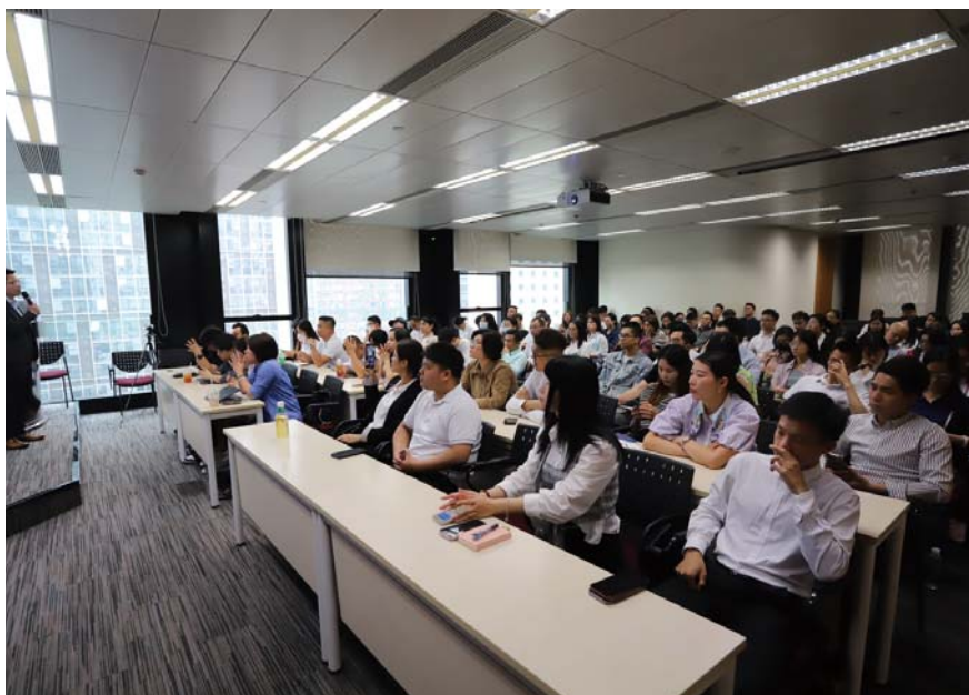
合富大学堂“达人养成计划PRO”系列讲座

把握数字时代之变，企业需要打造自身的数字化能力。合富辉煌未来将通过打造管理多维智能的数字化组织，实现人才发展数字化，运用数字化技术赋能每一个合富人的成长，建立企业人才资源的数字化图谱。