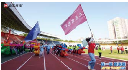
“在一起 赢未来”——合富辉煌集团2023新春运动会

我们重视员工的身心健康，倡导积极向上的工作生活方式，并致力于营造宽松而有活力的工作氛围。为此，我们组织了各类员工活动，如趣味运动会、徒步登山、演讲比赛及节日主题活动等，让员工能够在活动中放松身心，增进团队合作意识，培养团队凝聚力。这些活动不仅有助于保持员工的积极状态和团队士气，也鼓励员工与公司紧密合作，共同创造价值，分享美好。