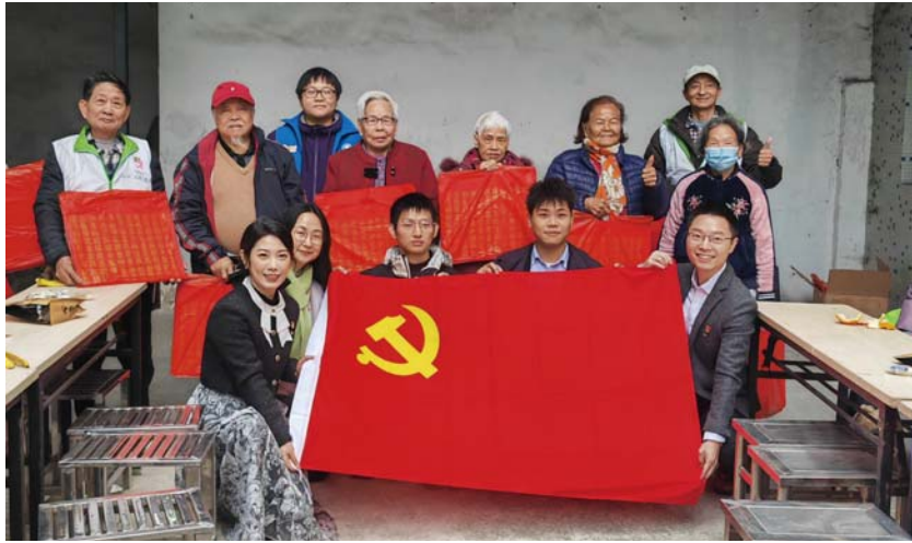
合富辉煌集团党委、团委联合开展社区慰问

建设美好未来的重要保障。在新时代的背景下，加强党建工作，促进企业发展与党建工作的深度融合，是合富辉煌集团党委必须重视和抓好的重要任务。