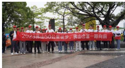
合富辉煌佛山公司员工参加“美丽佛山，一路向前”的五十公里徒步活动