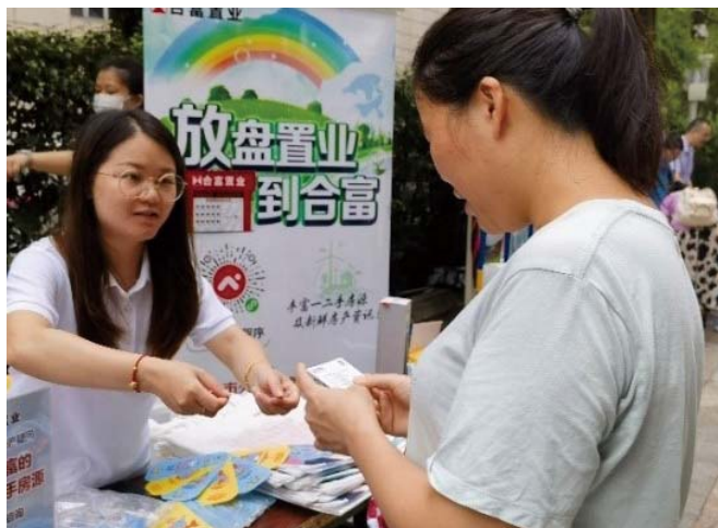
合富置业员工向社区居民进行环保科普宣传

2023年，合富置业携手广州市绿点公益环保促进会，以联盟成员身份，积极参与到政府各项公益环保活动的推进工作中。2023年合富置业共参加26场低碳生活连片示范活动，结合衣、食、住、行、用等全生活领域，以人为本开展全生活领域低碳生活示范活动，有效提升了示范片区的学生、居民、商户等多元公众群体对低碳生活的认知和认同，促进公众的生活习惯和行为改变。